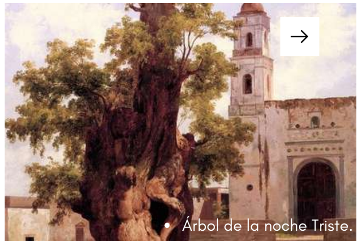
• Árbol de la noche Triste.

José María Velasco falleció el 26 de agosto de 1912 en la Ciudad de México, dejando un legado duradero en la historia del arte mexicano.