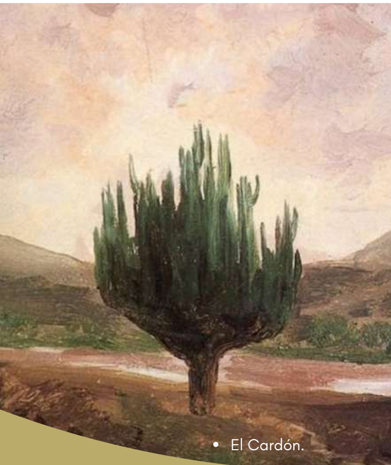
• El Cardón.